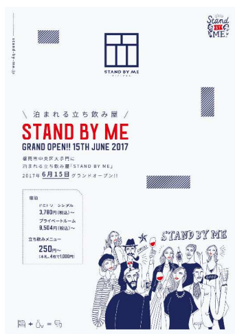
ポスタービジュアル